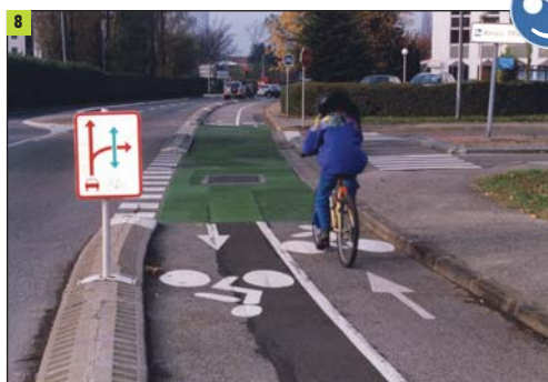
Photo 8 Prudence pour l'automobiliste avant de tourner à droite.