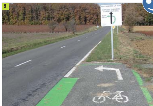
Le TAG pour cyclistes, peut également être réalisé en agglomération.

Là encore, diverses collectivités ont pris des initiatives qui suscitent notre encouragement, sur cet aspect sécuritaire (photos 8, 9 et 10).