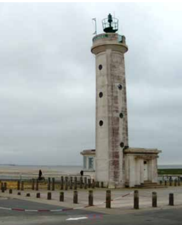
Phare du Hourdel en baie de Somme.

L'alignement des cabines en bois sur la plage (de galets) donne une drôle d'idée des vacances. Eu, vedette des cruciverbistes (trou normand) ; son château, résidence royale depuis Louis-Philippe, son parc fleuri, sa collégiale, son maire (!) et sa fameuse côte où nous sommes venus voir passer le Tour de France en 1955, année de la troisième victoire consécutive de Louison Bobet. La Louisonmania s'était emparée de la France vélocipédique et le « Va z'y Bobet » avait supplanté le « Va z'y Robic » en vogue depuis la victoire de Biquet dans le Tour 1947.