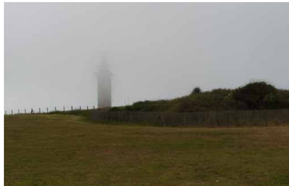
Phare du cap Gris-Nez.

J'ai 80 km au programme pour l'après-midi. Je dois harnacher homme et machine pour me protéger de la pluie qui ne me quittera plus pendant quatre heures. La route est bosselée à souhait et pas par de simples ondulations. Des passages parfois