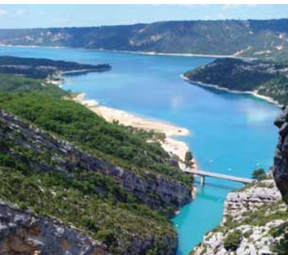
Le Verdon au lac de Sainte-Croix.

Je suis la rive droite du Verdon, a priori plus facile que l'autre appelée la Corniche sublime. À défaut, ce sera le Point sublime. Les longues côtes se succèdent, en compagnie d'essaims de mouches. Normal, je suis la seule bête en sueur à leur portée. La route s'écarte des gorges pour chercher le col d'Ayen à 1 031 m, puis y revient à l'approche du lac de Sainte-Croix.