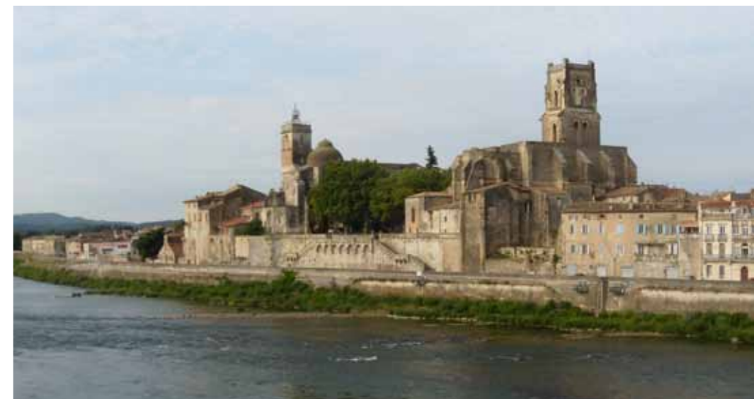
Le Rhône à Pont-Saint-Esprit.