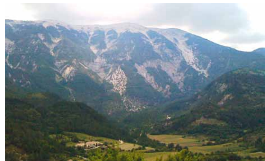
Le mont Ventoux.

Parcours sympa au milieu des vignobles des côtes du Rhône. J'ai encore assez de forces pour résister aux coups de vent à l'approche du Rhône que je traverse en admirant la belle vue sur Pont-Saint-Esprit. Rude journée quand même avec 135 km dans les pattes ; saleté de mistral ! ■