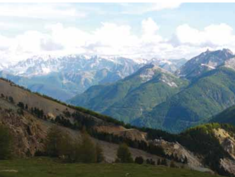
Vue de l'Izoard.

Pendant que je me prépare, un accompagnateur des champions dont aucun ne m'a salué vient tenter de m'expliquer l'attitude de ses poulains par leur crainte de voir abîmer leurs beaux vélos. Sans blague ? Commentaire de l'hôtesse : « Quels sauvages ! C'est ça le monde du vélo ? » Eh oui, chère madame, c'est cela aussi... En route pour 17 km de montée et 1 215 m de dénivelé. On mettra le temps qu'il faudra, mais on y arrivera... s'il ne neige pas ! Bonne surprise, j'étais persuadé d'être le mètre étalon de la lenteur et voici que je rattrape et dépasse facilement un couple, presque aussi chargé que moi. Au Plan Lachat, je savoure le long répit effectivement plat, qui prépare aux pentes suivantes, à plus de 10 %. Que c'est long un kilomètre en montagne, mais j'aperçois