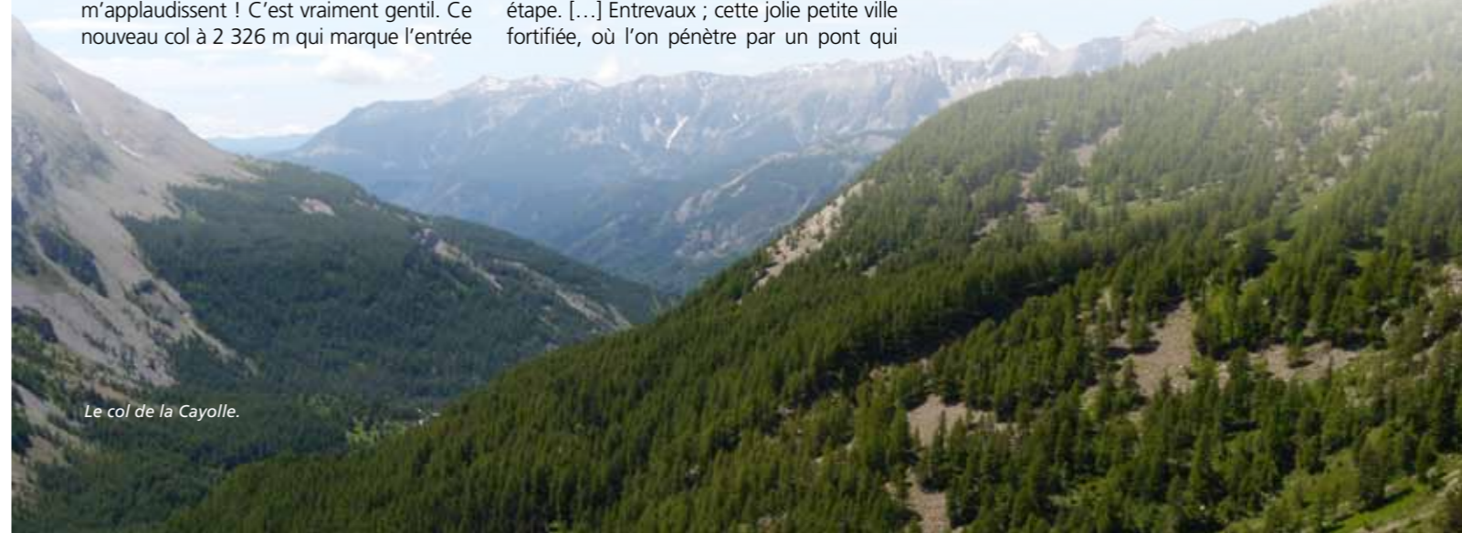
Le col de la Cayolle.

La dix-neuvième étape sera courte et me mènera à Castellane par le col de Vence et le BPF de Gréolières.