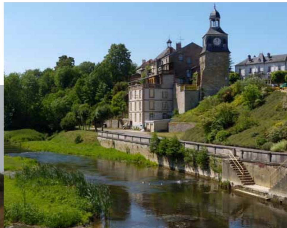
Tour de l'horloge à Varennes.

En guise d'échauffement, je m'offre une petite balade le long du canal des Ardennes qui relie l'Aisne à la Meuse. Il est équipé de quarante-quatre écluses dont vingt-six en moins de 10 km ; j'en ai quatre sous les yeux.