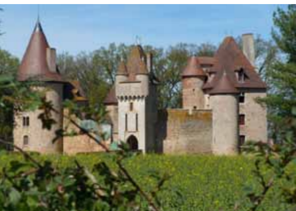
Château de Thoury (Allier).

Après Vichy, je rejoins Jaligny-sur-Besbre, surtout notable, pour nous cyclistes, grâce à son unique citoyen d'honneur, dixit René Fallet. Né à Villeneuve-Saint-Georges comme le Tour de France (re-dixit), il revendiquera toujours ses attaches bourbonnaises. Écrivain