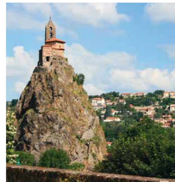
L'église Saint-Michel d'Aiguilhe.

Mon harnachement ne passe pas inaperçu au milieu de cet interminable peloton. Tout cela est très sympa parce que momentané, mais me conforte dans ma position de rouleur solitaire. Je ne suis vraiment pas fait pour ces grosses manifestations ; pardon aux adeptes des SF. Je ne cherche pas à suivre le rythme, au demeurant assez modeste – j'apprendrai qu'ils sont partis pour environ 200 km – et je vais au mien, m'arrêtant pour me ravitailler, photographier les grandioses paysages de l'Ardèche et de la Haute-Loire, et les cols qui s'y succèdent : Montivernoux (1 320 m), Pranlet (1 363 m), Bourlatier (1 411 m). Plus nous gagnons en altitude et plus le vent nous agresse ; ici, rien ne peut l'arrêter. Tout le monde en bave, particulièrement à l'approche du mont Gerbier de Jonc, curieux monticule où la Loire prend sa source, point de convivialité de l' Ardéchoise , et mon BPF du jour. L'étape, avec arrivée au Puy-en-Velay, est