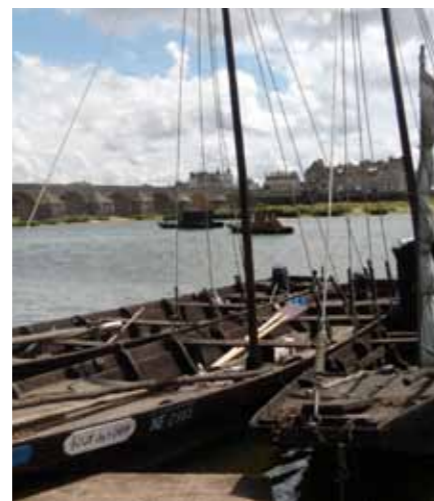
La Loire à Gien.

Oui, j'ai fait un beau voyage ; notre pays est magnifique.